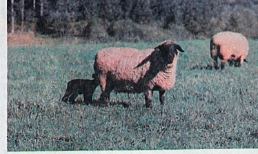
O Rio Grande do Sul quer aumentar a produção de carne ovina, com incentivo à tipificação de carcaças. PÁG. G-4