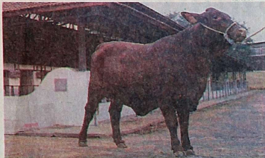
A raça santa gertrúdis foi uma das atrações da Emapa; a exposição em Avaré (SP) acabou no domingo. PÁG. G-5