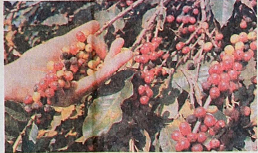
A produção de café deve sofrer nova queda em 91, mas a tendência no mercado internacional é de alta. PÁG. G-3