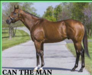
CAN THE MAN