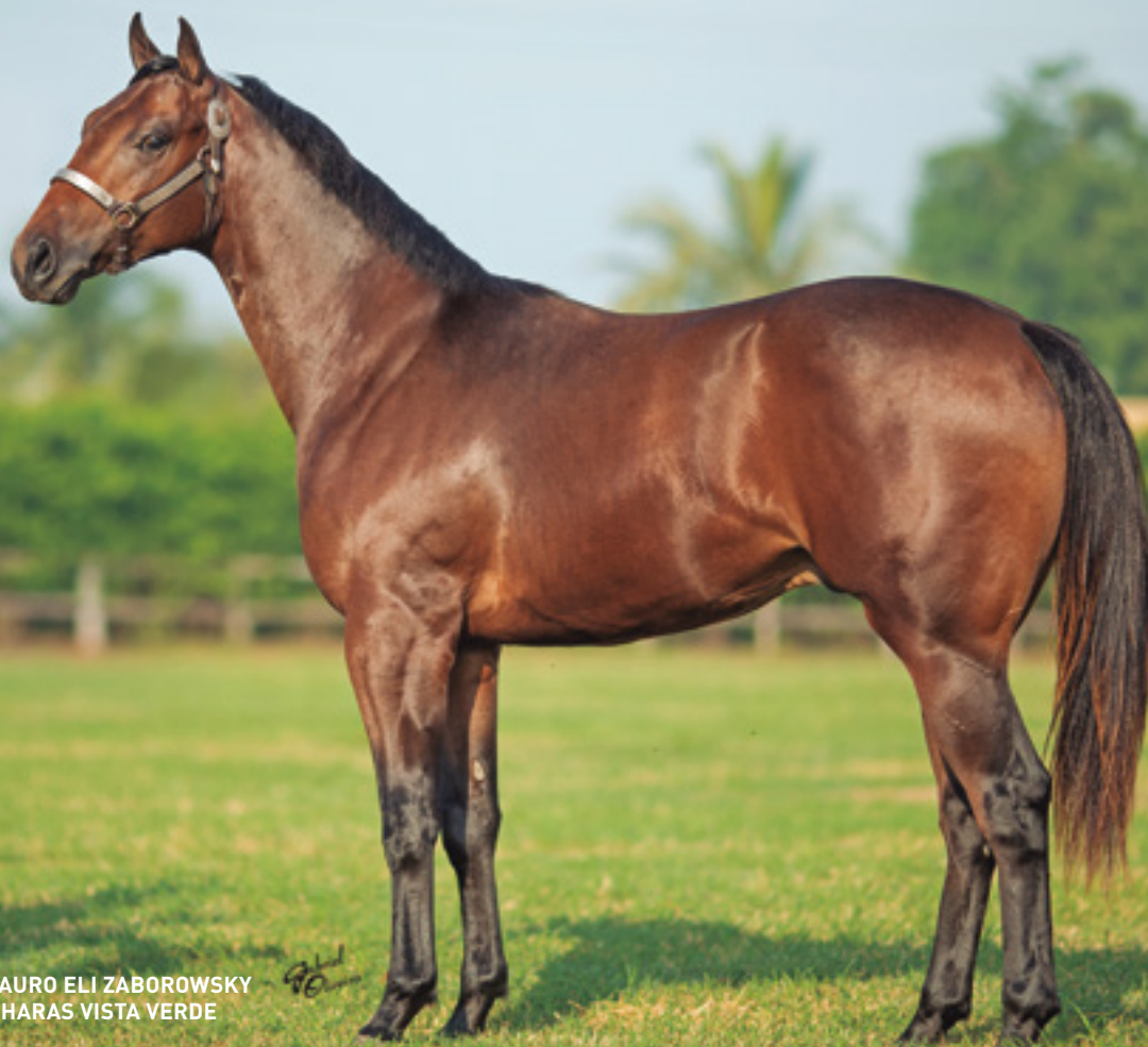
CRIADOR: MAURO ELI ZABOROWSKY VENDEDOR: HARAS VISTA VERDE

IRMÃO PRÓPRIO DE YANKEE VERDE AAT - 106 - 9 VITÓRIAS, BI-RECORDISTA DOS 301 METROS, E DOS 320 METROS. GANHADOR DO GP TORNEIO INÍCIO, GP REI DA VELOCIDADE, GP SOROCABA FUTURITY, GP PRESIDENTE DO C. HIPICO D'OESTE - I DERBY, GP CHALLENGE 2020. R$ 556.622,00 EM PRÊMIOS + R$ 100.000,00 DO BÔNUS VISTA VERDE POR TER GANHADO O GP TORNEIO INÍCIO. REPRODUTOR