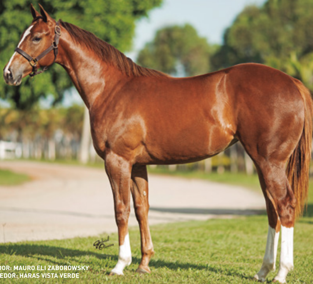
CRIADOR: MAURO ELI ZABOROWSKY VENDEDOR: HARAS VISTA VERDE

SUA MÃE ACIDENTOU-SE QUANDO VINHA NA FRENTE DO GP RAINHA DA VELOCIDADE. IRMÃ MATERNA DE VENUS VISTA AAAT 102, FILHA DE SUMMER TOLL- TRÍPLICE COROADA, MÃE DE BRASILIA TOLL AAAT, FORTALEZA TOLL AAAT.