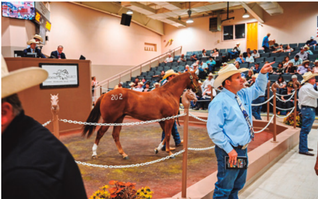
Ruidoso Select Yearling Sale 2020

CONFIRA OS NÚMEROS ATUAIS DOS MERCADOS BRASILEIRO E AMERICANO