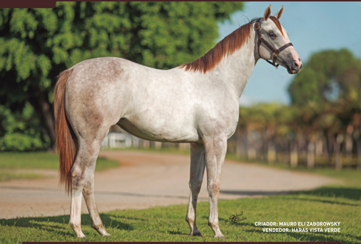
CRIADOR: MAURO ELI ZABOROWSKY VENDEDOR: HARAS VISTA VERDE

IRMÃ MAT. DE YASHIRA VISTA - AAAT-104 – 3 VITÓRIAS 10. GP CONSAGRAÇÃO. NOS EUA É AAAT 101 – ESTÁ EM CAMPANHA 3 VITÓRIAS – GANHADORA DE MAIS DE R$ 300.000,00 . FINALISTA DO GOLDEN STATE DERBY - ÚNICO ANIMAL BRASILEIRO A SER FINALISTA DE UM FINALISTA DE DERBY NOS EUA. VENCEDORA CLÁSSICA DO ARC DISTAFF CHALLENGE – GRUPO 1