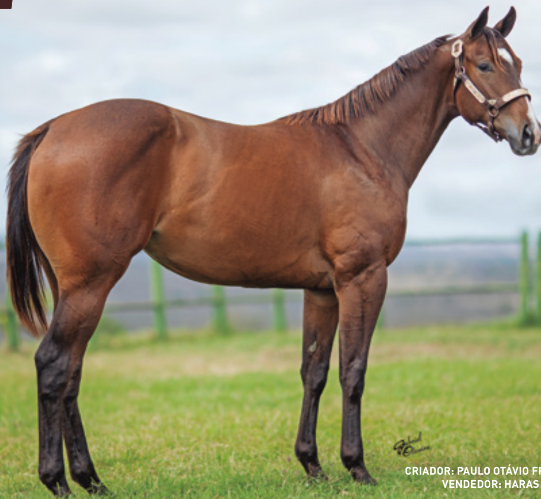
CRIADOR: PAULO OTÁVIO FREIRE MACEDO VENDEDOR: HARAS MONTE VERDE

SUA MÃE É GANHADORA CLÁSSICA COM 6 VITÓRIAS E U$ 179.968, E IRMÃ DO CAMPEÃO MUNDIAL HE LOOKS HOT, AAAT-103 . 14 VITÓRIAS E U$ 1.618.055. AQHA WORLD CHAMPION . AVÓ GANHADORA CLÁSSICA AAAT-101 . 4 VITÓRIAS E U$ 170.549. BISAVÓ PRODUTORA DE GARANHÕES: HAWKISH E HAWKINSON