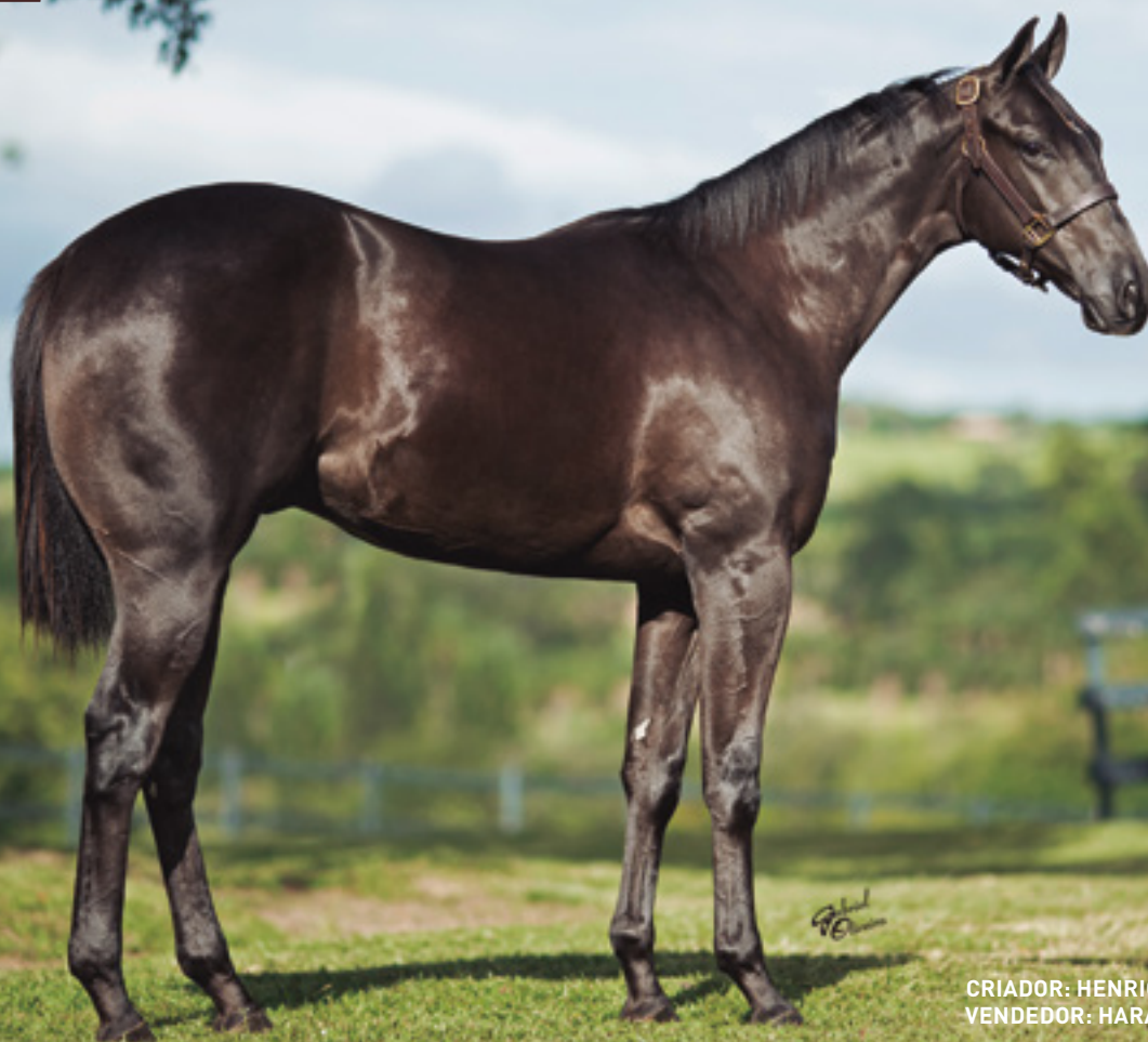
CRIADOR: HENRIQUE ABRAVANEL VENDEDOR: HARAS JA SE VIERAM

FAMÍLIA DA DASHING AND DARING, MÃE ENTRE OUTROS DO GARANHÃO TOLLTAC DARING.