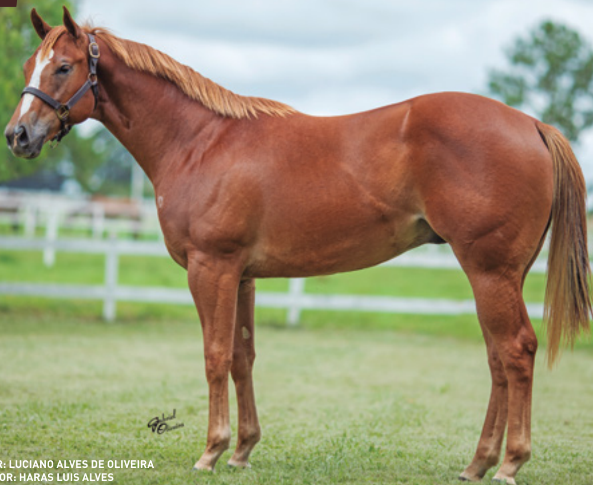
CRIADOR: LUCIANO ALVES DE OLIVEIRA VENDEDOR: HARAS LUIS ALVES

MÃE FILHA DE TRES SEIS , IRMÃ DE MDT STREETFIGHTER , AAAT-105 - 5 VITÓRIAS E U$ 200.341 . AVÓ É GANHADORA CLÁSSICA AAAT-105 - 9 VITÓRIAS E U$ 168.346 - PRODUTORA CLÁSSICA.