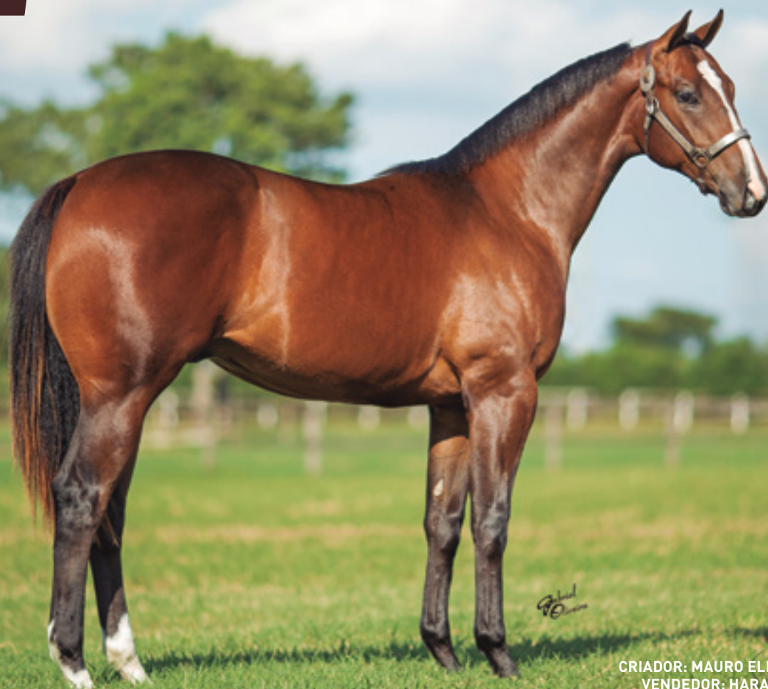
CRIADOR: MAURO ELI ZABOROWSKY VENDEDOR: HARAS VISTA VERDE

SUA MÃE É IRMÃ DE DASHING FOLLIES , PRODUTORA DOS GARANHÕES, PYC PAINT YOUR WAGON AAAT-107. 7 VITÓRIAS E U$ 889.581 E IVORY JAMES AAAT-103. 5 VITÓRIAS E U$220.026. JUNTOS PRODUZIRAM GANHADORES DE MAIS DE US$ 55.000.000