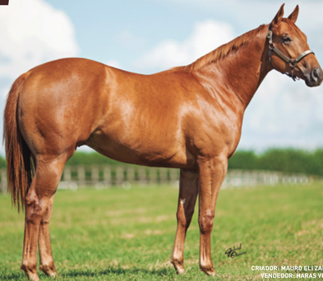
CRIADOR: MAURO ELI ZABOROWSKY VENDEDOR: HARAS VISTA VERDE

SUA MÃE GANHOU 3 EM LOS ALAMITOS, E É IRMÃ DO REPRODUTOR FANTASTIC CORONA JR – AAA 97 – US$ 541.896, PAI DE FANTASTIC FLY APOLLO – 2020 – AQHA SOUTH AMERICAN CHAMPION E CAMPEÃO DOS CAMPEÕES.