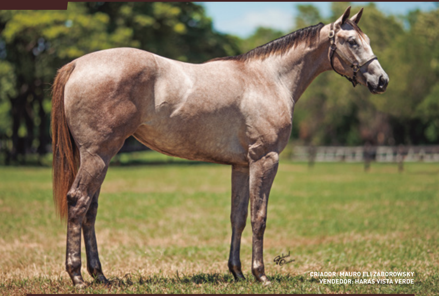
CRIADOR: MAURO ELI ZABOROWSKY VENDEDOR: HARÁS VISTA VERDE

IRMÃ DA RAINHA DA VELOCIDADE - XARON VISTA, AAAT-104 . 4 VITÓRIAS. SUA MÃE É IRMÃ MATERNA DOS GARANHÕES HAWKISH AAAT-106 - 8 VITÓRIAS E U$685.631, HAWKINSON - AAA-99 . 9 VITÓRIAS E U$448.299 EM PRÊMIOS, E MAIS 5 GANHADORES CLÁSSICOS.