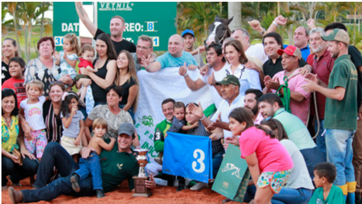
Festa na vitória de Adele Vista no GP Torneio Início 2019 - Stud dos Amigos levou o Bônus de R$ 100.000,00 pela criação Vista Verde