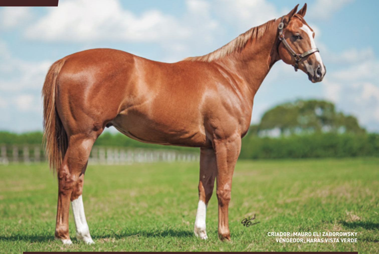
CRIADOR: MAURO ELI ZABOROWSKY VENDEDOR: HARAS VISTA VERDE

IRMÃO PRÓPRIO DE XANTILLY VISTA , AAAT-101. VICE-CAMPEÃ DO GRANDE PRÊMIO TORNEIO INÍCIO GP TORNEIO INÍCIO/16