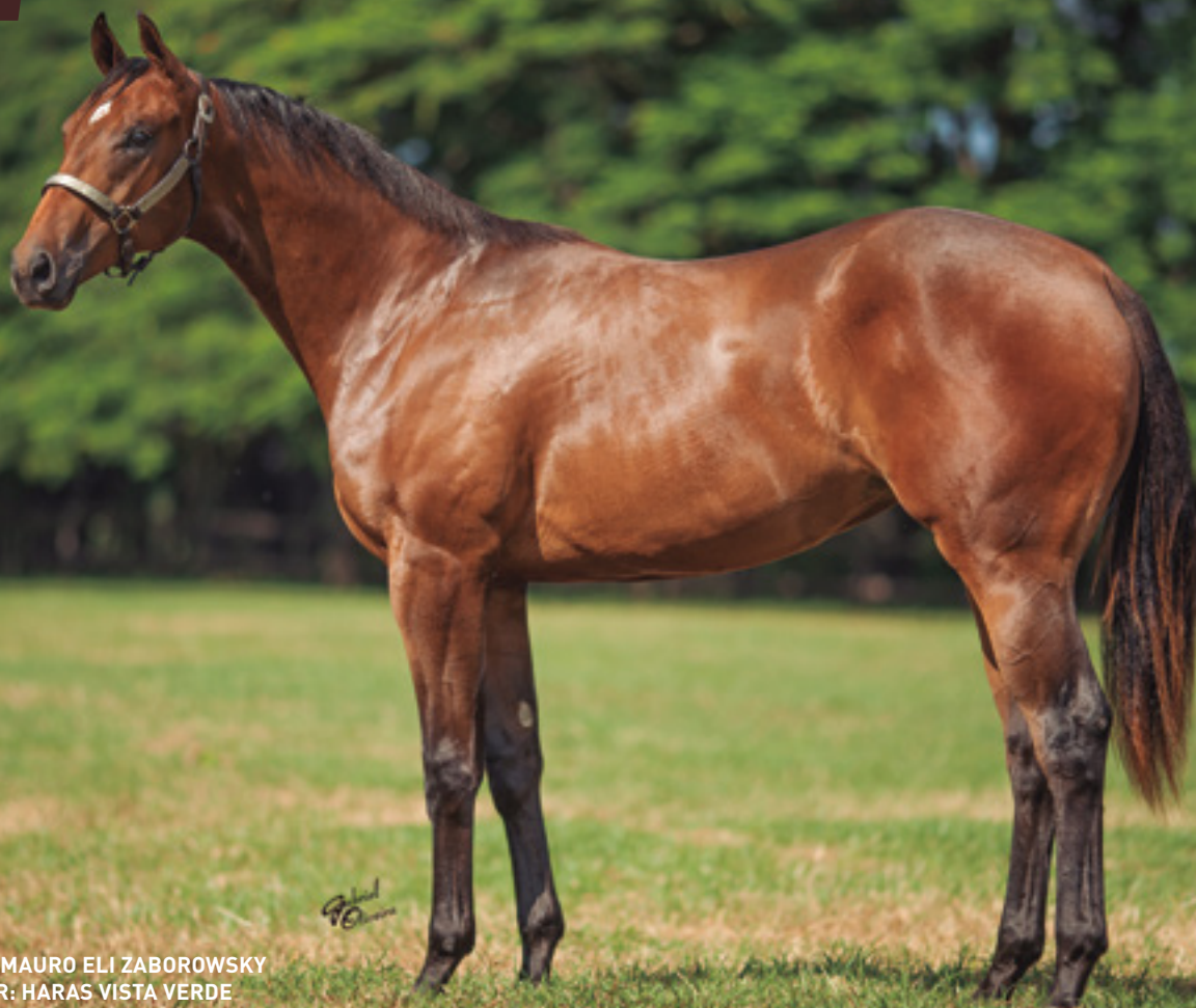
CRIADOR: MAURO ELI ZABOROWSKY VENDEDOR: HARAS VISTA VERDE

SUA MÃE, WITCH VISTA AAAT , É IRMÃ MATERNA DO CAMPEÃO DOS CAMPEÕES YOYO VERDE AAAT , DE XTELLA VISTA AAAT , DE ZUCKERBERG VERDE (SOLITÁRIO) .