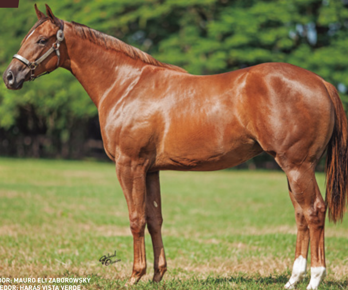
CRIADOR: MAURO ELI ZABOROWSKY VENDEDOR: HARAS VISTA VERDE

IRMÃ PRÓPRIA DE BÉLGICA VISTA AAA-93 . SUA MÃE É FILHA DIRETA DE CORONA CARTEL E IRMÃ PRÓPRIA DE EYE FOR CORONA - AAA-99 - U$ 1.100.121,00 GANHADORA DO GOLDEN STATE MILLION FUTURITY-G1