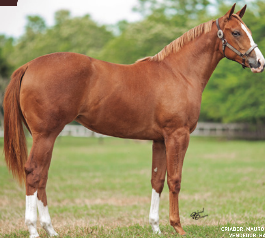
CRIADOR: MAURO ELI ZABOROWSKY VENDEDOR: HARAS VISTA VERDE

SUA MÃE É IRMÃ PRÓPRIA DE IRMÃ PRÓPRIA DE JD BACCARAT (AAAT-117 E U$ 247.240) – FINALISTA DO ALL AMERICAN FUTURITY. SUA AVÓ IRMÃ PRÓPRIA DE CORONA KOOL U$ U$1.296.797 E MATERNA DE CORONA CHICK U$ 591.326 (MÃE DE CORONA CARTEL)