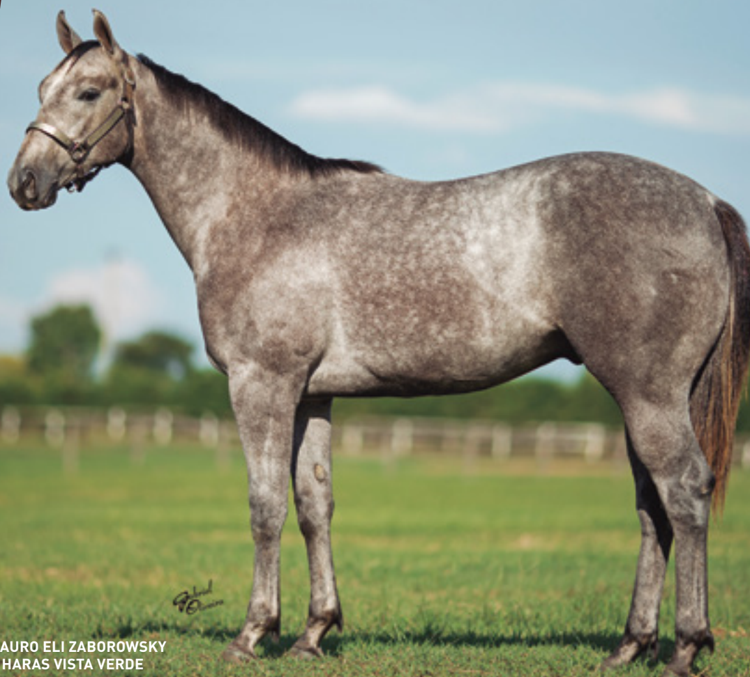
CRIADOR: MAURO ELI ZABOROWSKY VENDEDOR: HARAS VISTA VERDE

IRMÃO PRÓPRIO DE YELLOW VERDE - AAAT-103. 3 VITÓRIAS - R$ 93.667,00 - 2º NO GP TORNEIO INÍCIO, FINALISTA DO GP MEGARACE E DO GP POTRO DO FUTURO