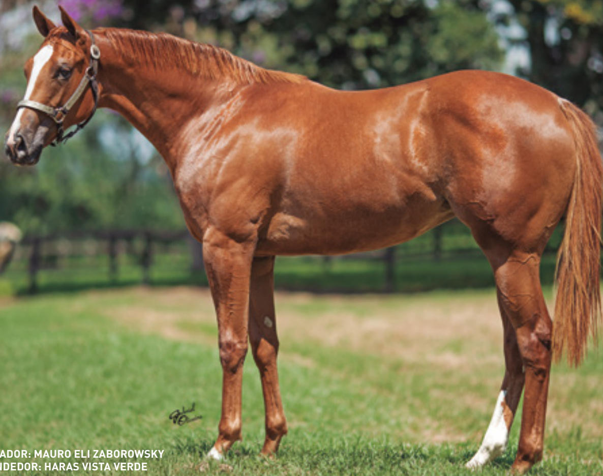
CRIADOR: MAURO ELI ZABOROWSKY VENDEDOR: HARAS VISTA VERDE

IRMÃ MAT. DE UISQUE VERDE - AAAT-101 . 12 VITÓRIAS - R$ 258.806,52 EM PRÊMIOS. MELHOR CAVALO 2014 - ABQM AWARDS.