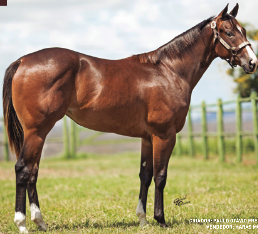
CRIADOR: PAULO OTÁVIO FREIRE MACEDO VENDEDOR: HARAS MONTE VERDE

SUA MÃE É IRMÃ MATERNA DE CRAQUES, COMO GOOD REASON SA (AAAT-102, AQHA CHAMPION, GANHADOR DE U$1.446.227) . AVÓ GANHADORA CLÁSSICA PRODUTORA DE GARANHÕES