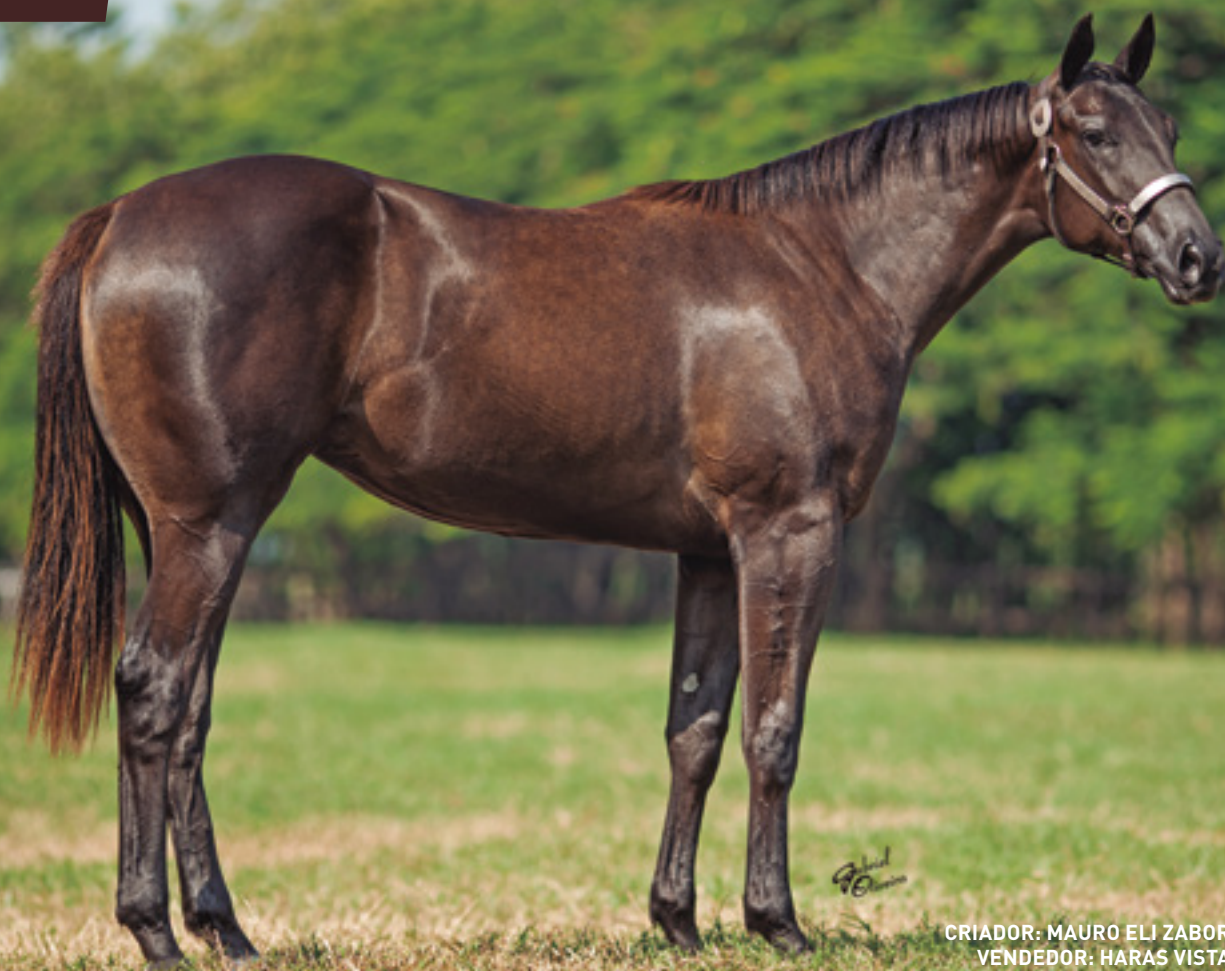
CRIADOR: MAURO ELI ZABOROWSKY VENDEDOR: HARAS VISTA VERDE

SUA MÃE É IRMÃ DE 5 GARANHÕES: JOHNNY VERDE - AAA-96 - 6 VITÓRIAS, PLUTO VERDE - AAAT-105. 10 VITÓRIAS, TIGER VERDE - AAA-98 - 3 VITÓRIAS, ROBINHO VERDE - AAA-92 REMY VERDE , AAA E AINDA MICKEY VERDE AAAT-101, 2 VITÓRIAS. UMA DAS 5 MELHORES ÉGUAS DE CORRIDA DE TODOS OS TEMPOS ABQM.