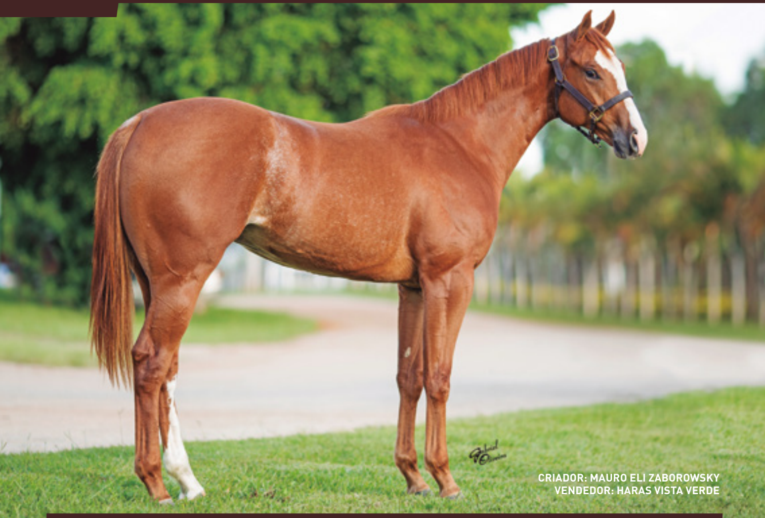
CRIADOR: MAURO ELI ZABOROWSKY VENDEDOR: HARAS VISTA VERDE

IRMÃ MATERNO DO CAMPEÃO DOS CAMPEÕES – SOUTH AMERICA AQHA CHAMPION - YOYO VERDE AAAT , DE WITCH VISTA AAAT , DE XTELLA VISTA AAAT , DE ZUCKERBERG VERDE ( SOLITÁRIO )