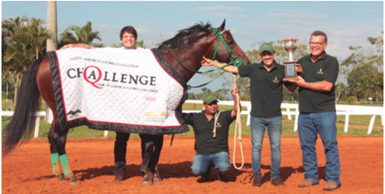
Comemoração na vitória de YANKEE VERDE no Challenge 2020, que teve ainda ZION VERDE como vice-campeão

TODOS OS ANIMAIS LEILÃO VISTA VERDE E AMIGOS ESTÃO INSCRITOS PARA CORRER O CHALLENGE