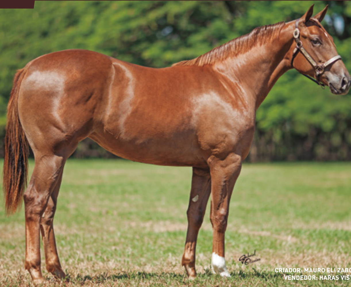
CRIADOR: MAURO ELI ZABOROWSKY VENDEDOR: HARAS VISTA VERDE

SUA MÃE É IRMÃ MAT DE ZIDORF VERDE - AAAT-103 - 3º NO GP MEGARACE. DE APPLE VISTA AAAT - FINALISTA GP CONSAGRAÇÃO. SUA AVÓ IMPORTADA - AAA-98. ÉGUA DO ANO EM OKLAHOMA - 2013 - GANHADORA CLÁSSICA COM 6 VITÓRIAS E U$190.758,00 - 1º JUNO'S REQUEST S.(G2), 1º LOS ALAMITOS DISTAFF CHALLENGE (G3). FAMÍLIA MATERNA DE JESS LOUISIANA BLUE