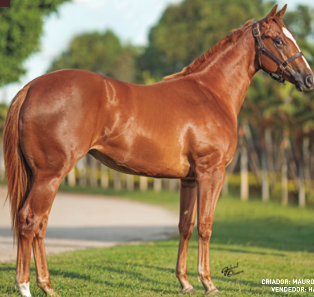
CRIADOR: MAURO ELI ZABOROWSKY VENDEDOR: HARAS VISTA VERDE

IRMÃ MATERNA DO GARANHÃO HABITS SECRETS , AAAT-109. 10 VITÓRIAS E U$330.334, DE ZECRETO VERDE , AAAT-102 E DE YES SECRET VERDE, ( PABLITO ). VENCEDOR DO GP INTERNACIONAL EM CORONEL OVIEDO/17. LINHA MATERNA DE FISHERS DASH.