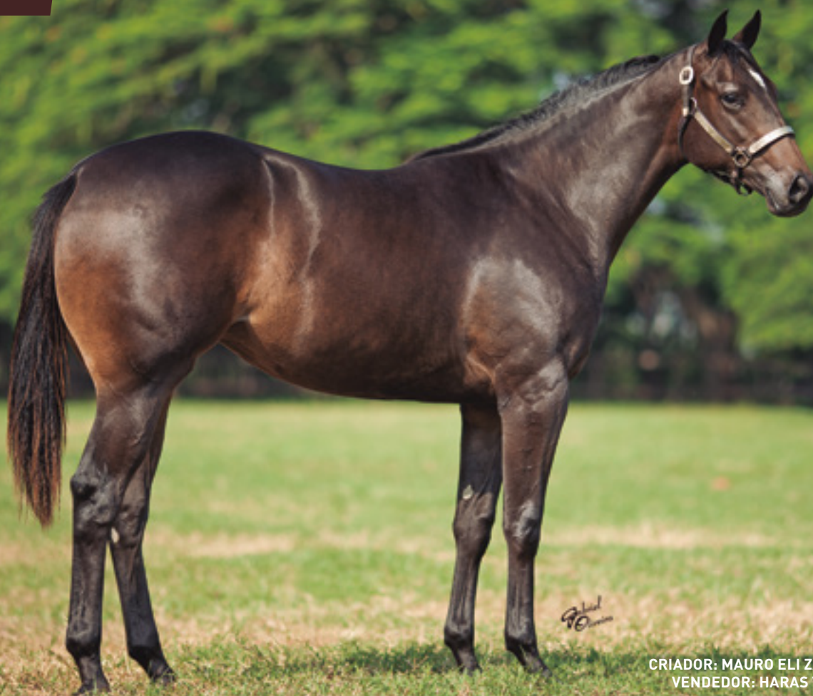
CRIADOR: MAURO ELI ZABOROWSKY VENDEDOR: HARAS VISTA VERDE

IRMÃ MATERNO DO CAMPEÃO DOS CAMPEÕES – SOUTH AMERICA AQHA CHAMPION - YOYO VERDE AAAT , DE WITCH VISTA AAAT , DE XTELLA VISTA AAAT , DE ZUCKERBERG VERDE (SOLITÁRIO)