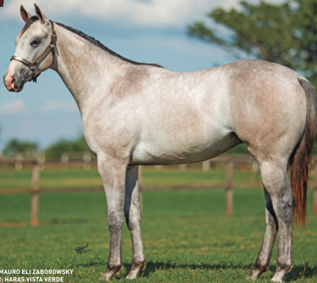
CRIADOR: MAURO ELI ZABOROWSKY VENDEDOR: HARAS VISTA VERDE