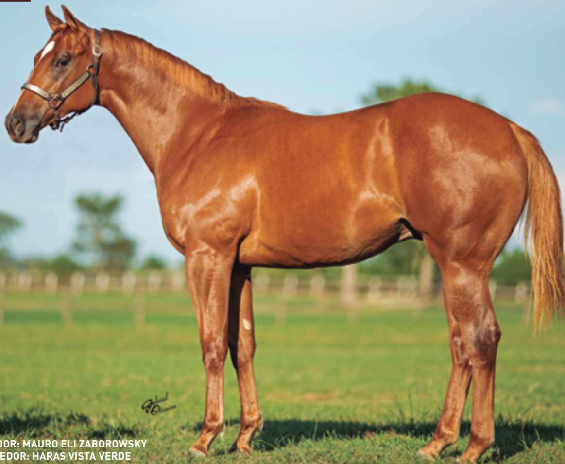
CRIADOR: MAURO ELI ZABOROWSKY VENDEDOR: HARAS VISTA VERDE

IRMÃO DA RAINHA DA VELOCIDADE - XARON VISTA , AAAT-104. 4 VITÓRIAS. SUA MÃE É IRMÃ MATERNA DOS GARANHÕES HAWKISH AAAT-106 - 8 VITÓRIAS E U$685.631, HAWKINSON - AAA-99. 9 VITÓRIAS E U$448.299 EM PRÊMIOS, E MAIS 5 GANHADORES CLÁSSICOS.