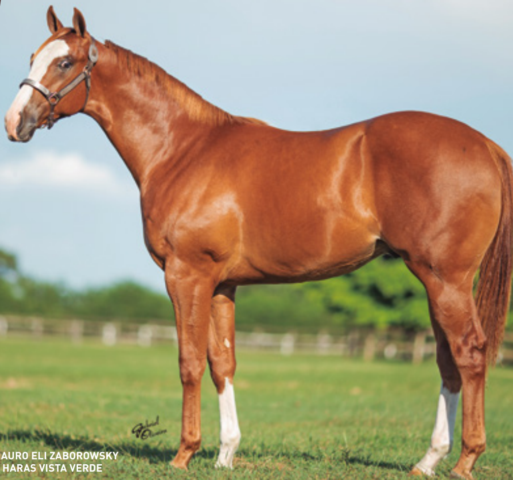
CRIADOR: MAURO ELI ZABOROWSKY VENDEDOR: HARAS VISTA VERDE

SUA MÃE É FILHA DIRETA DE FIRST DOWN DASH, SUA AVÓ É IRMÃ DE RUNAWAY WAVE , MELHOR ÉGUA DO MUNDO, MÃE DE DIVERSOS GARANHÕES, COMO OS CAMPEÕES MUNDIAIS OCEAN RUNAWAY AAAT 105 10 VITÓRIAS E U$ 1.642.498 E WAVE CARVER , AAAT-104, 11 VITÓRIAS E U$ 1.005.946