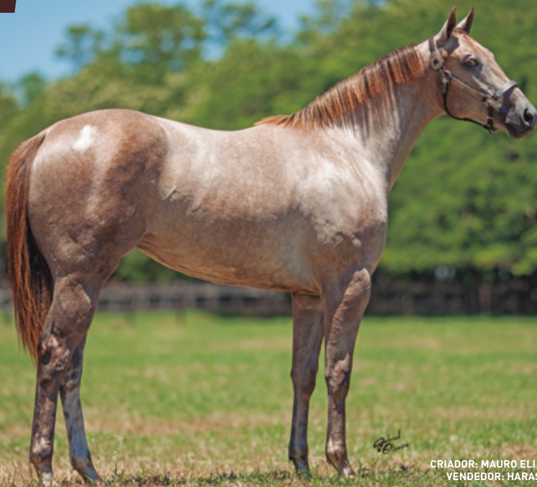
CRIADOR: MAURO ELI ZABOROWSKY VENDEDOR: HARAS VISTA VERDE

SUA MÃE É IRMÃ DE DINASTIA TOLL AAAT 108 – GANHADORA DE MAIS DE R$ 1.000.000, E PRODUTORA NOS EUA DE CRAQUES COMO O GARANHÃO FDD DYNASTY - AAAT-102 - U$1.173.001,00 E PRODUTOR DE +U$ 23 MILHÕES